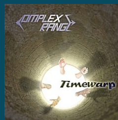
Complex Range Timewarp